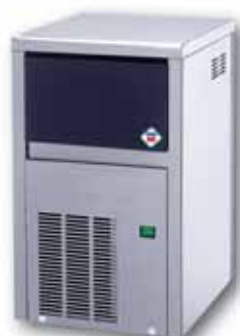
IMC 2104 A/W