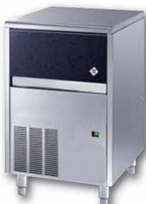
IMC 3316 A/W